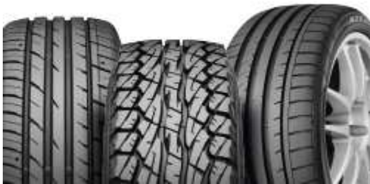
( http://falken-europe.fr/ )