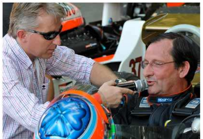
( communication-et-tv-production.aspx )