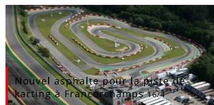
Nouvel asphalte pour la piste de karting à Francorchamps 16/4