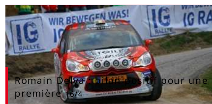
Romain Delya : un rallye positif pour une première 16/4