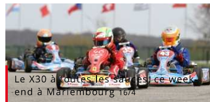
Le X30 à toutes les sauces ce week-end à Mariembourg 16/4